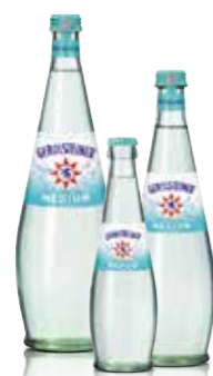
Gerolsteiner Medium erhältlich in den Größen 0,25l, 0,5l und 0,75l