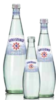
Gerolsteiner Sprudel erhältlich in den Größen 0,25l, 0,5l und 0,75l