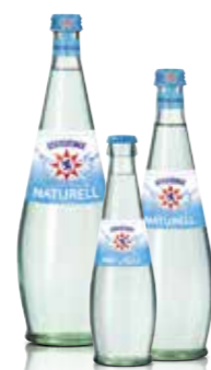
Gerolsteiner Naturell erhältlich in den Größen 0,25l, 0,5l und 0,75l